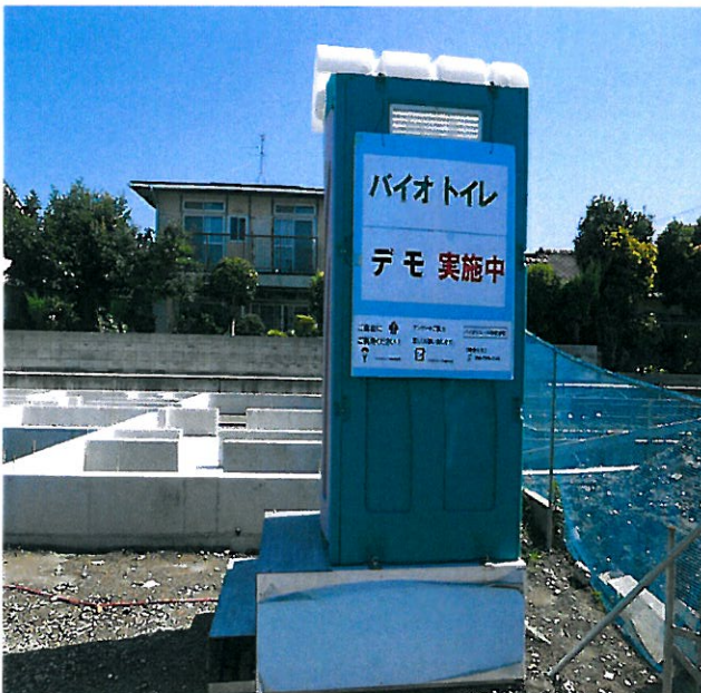
《バイオトイレ外観》